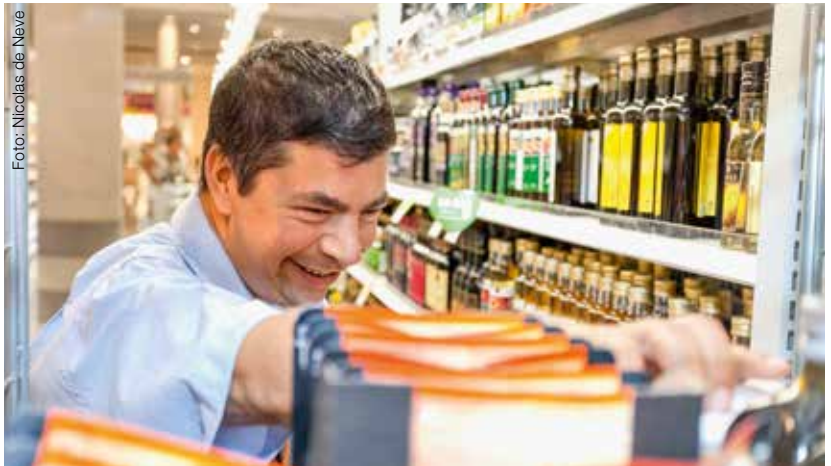
Nur wenige Arbeitgeber sind bereit, Menschen mit Handicap anzustellen.

Als Anwältin des Rechtsdienstes von Procap berate ich viele Menschen mit Handicap in sozialversicherungsrechtlichen Fragen und beobachte, dass der Druck durch die Behörden generell zunimmt. Bei den Eingliederungsmöglichkeiten auf dem Arbeitsmarkt sieht es jedoch für Menschen mit Behinderungen schlecht aus. Die meisten unserer Ratsuchenden möchten im Rahmen ihrer gesund-